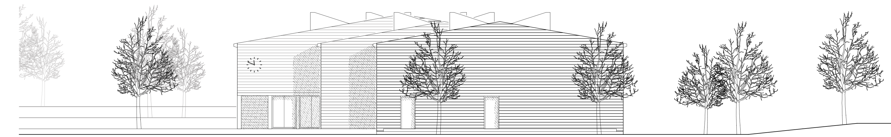
Ansicht Süd M:1/200